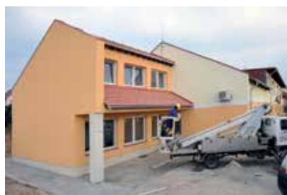
Utolsó simítások az óvoda bővítésén

Számomra a Karácsony az emberiség, a meghittség és a szeretet ünnepe. Jelentősége abban rejlik, hogy tiszteljük önmagunkban az embert és képesek vagyunk kiemelkedni a mindennapokból. Minden embernek szüksége van az ünnepre, és az ünnep adta öröme, amit a szeretteinkre fordított idő tesz igazán széppé, és mert bátorítást és új lendületet is adhat életünkben. Nagyon jó lenne, ha a szeretet, a jó szándék, egymás kölcsönös tisztelete lenne meghatározó mindennapjaink során is. A karácsonyi ünnepek alkalmat kínálnak arra is, hogy az ember még közelebb kerüljön azokhoz, akiket kedvel és szeret, amikor érezhetjük, hogy nem csak kapni, de