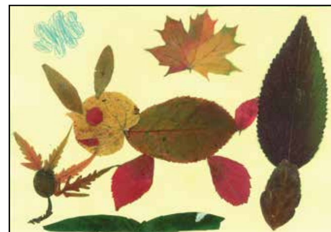
Semlyén Flóra középső csoport