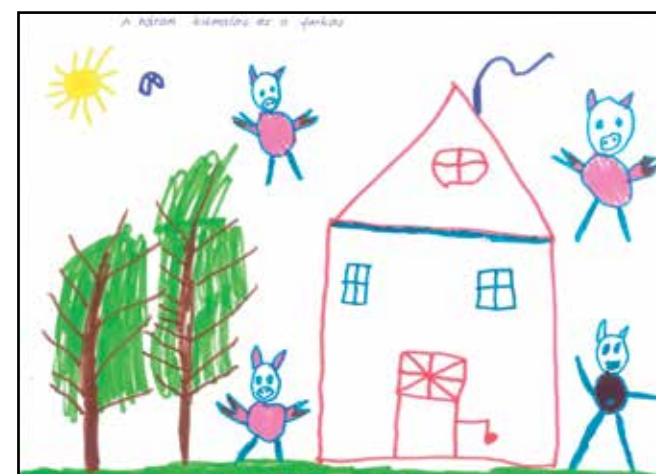
Benyovszki Borisz nagycsoport