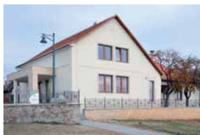
A megújult Kultúrház (Civilház)

Rengeteg a teendőnk, hogy egy modern, megújult Sukorót mondhassunk magunkénak. Hamarosan megkezdődik a Főtér megújításának II. üteme, amelyre bruttó: 23 millió Ft. támogatást nyertünk a Leader pályázat keretében. Újabb örvendetes hírről számolhatok be Önöknek. A nyári esőzések okozta károk elhárítására, a megrongálódott útjaink javítására három vis major pályázatot adtunk le a Belügyminisztérium felé. A tárca mindegyik pályázatunkat nyertesnek nyilvánította, így összesen: 4,5 mill. Ft. jut a Moha utca, és a Magos-Csend utca kereszteződésének aszfaltozására, az Erdőalja, Magos utcák kátyúzására, javítására, valamint a Berkenye utca Köpüs utca felőli lejtős földútnak, és az Ady utcából nyíló önkormányzati földútnak makadám úttá történő helyreállítására. A javításokkal egyidejűleg a vízelvezést is igyekszünk megoldani ezeken a területeken.