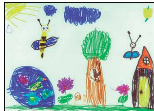
Török Réka nagycsoport