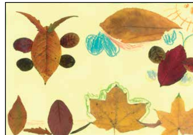
Krausz Viktória nagycsoport