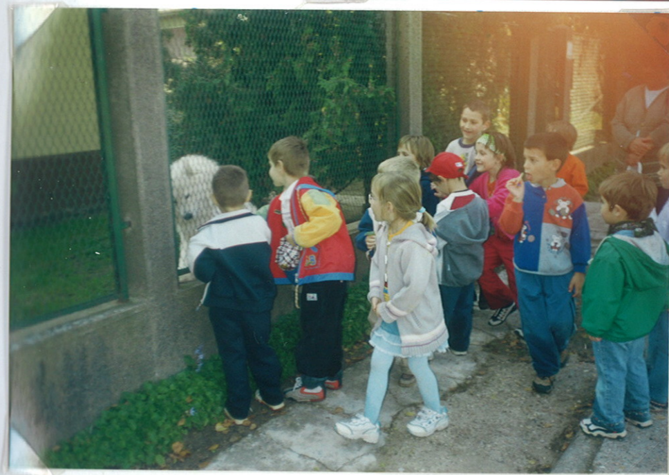
A buszmegállóban. Pakozdon.