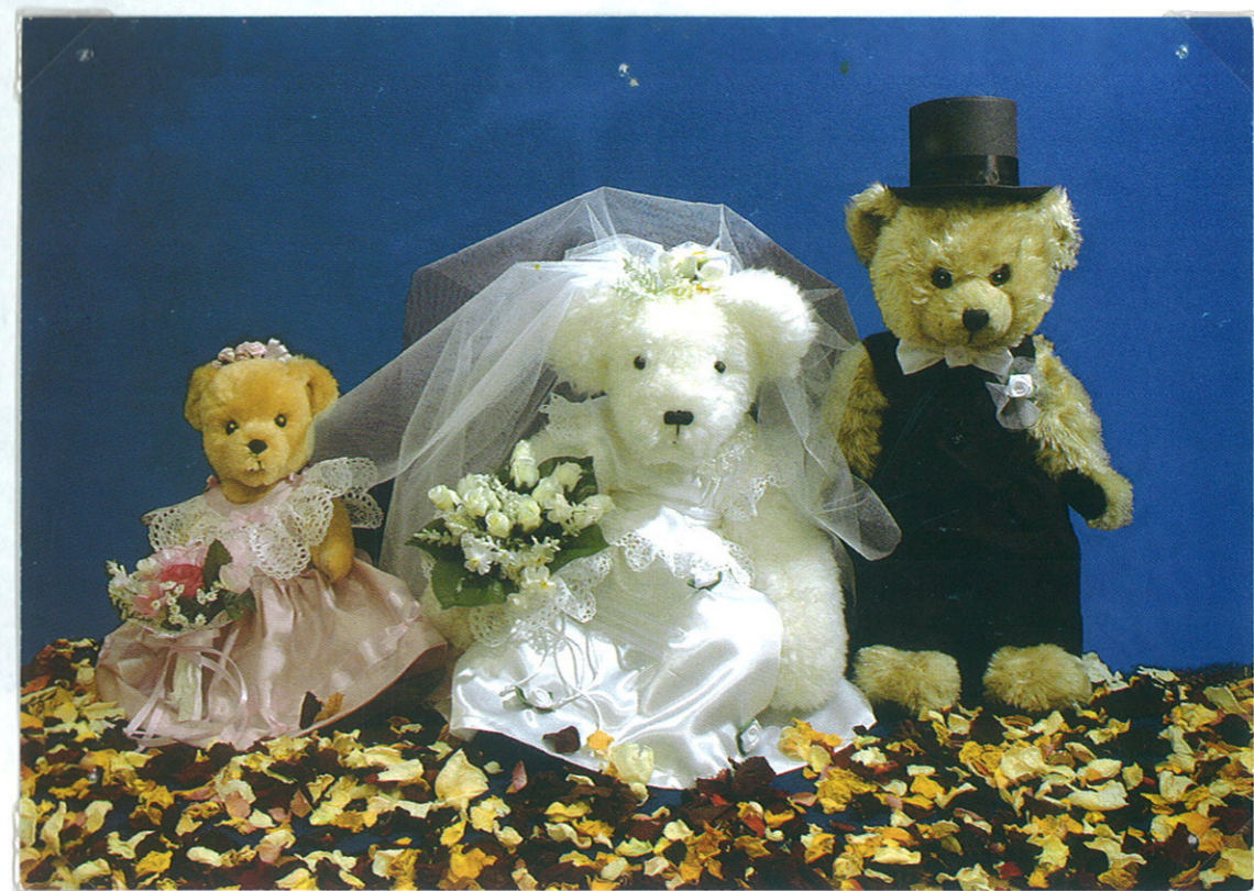
Mackókiallítóison mackó esküvőt is láthattunk.

Ballagásra, szülői összefogással renobeltük az udvart. Növényeket megmunkítottuk, újakat ültettünk. Az ágyások köré kiskertetést állítottunk. A tavasz folyamán újabb szekrényrost készítettünk, a meglévőket az ajtóit ugyanolyan színűre csíktettük, - így egységes képet mutat a berendezés.