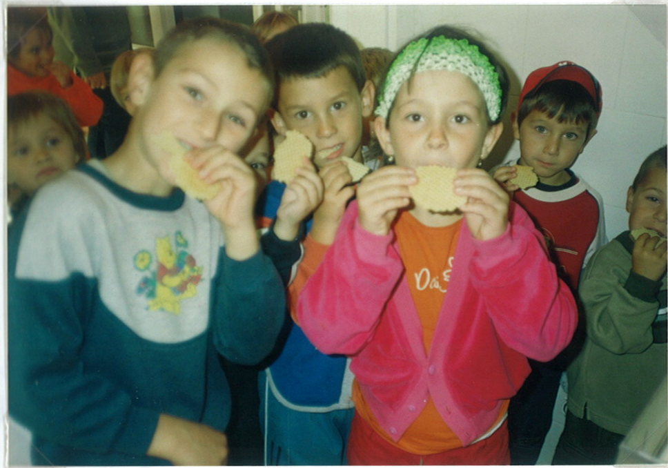
Friss, finom a sajtos tallér.

Autóbuszszal ritkán utaznak gyermekeink, így hőt a közös "buszozás" is élmény volt számukra.