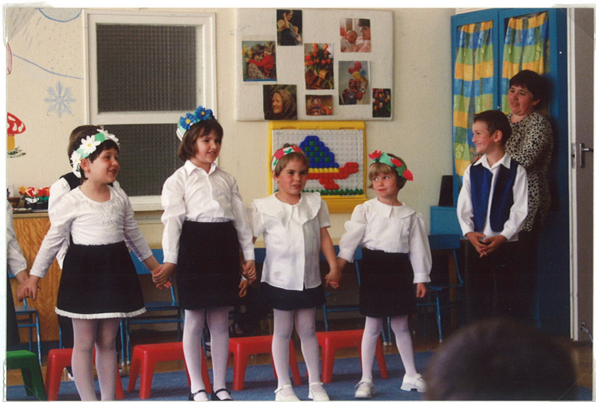
Anyák napi műsor az óvodában „virágok, saját készítésű „süteménnyel” kíváztuk meg az édesanyjakat, nagymamákat.