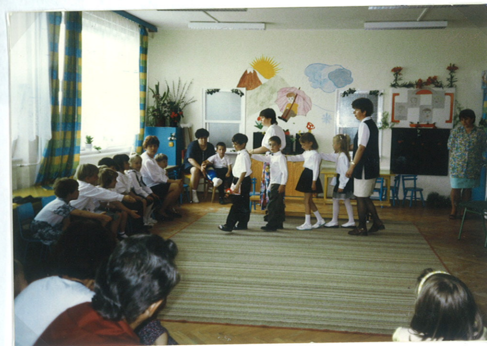
A négy ballagó-nagycsoportosunk:

En a nap egyben a nagysok kiránduló napja is volt. Először a közeli arborétumba, a népnaxi házba is