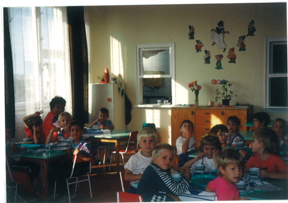
Tízónásunk az órában.

A faluban 6 "folunikulás" jött háról hárna, s megajándékozta a gyerekeket.