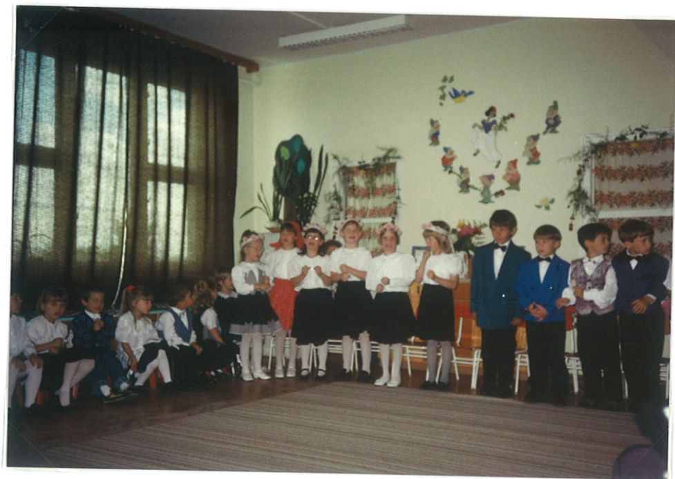
A nagycsoportosok évtári műsora: Leánykeres.

Székesfehérváron a Pelikán teremben gyerekelőadást nézhetünk a címe: Manóbosszantó. A „színház” után sétáltunk a városban. Ellátogattunk a köldök és vörösgyümölcs is.