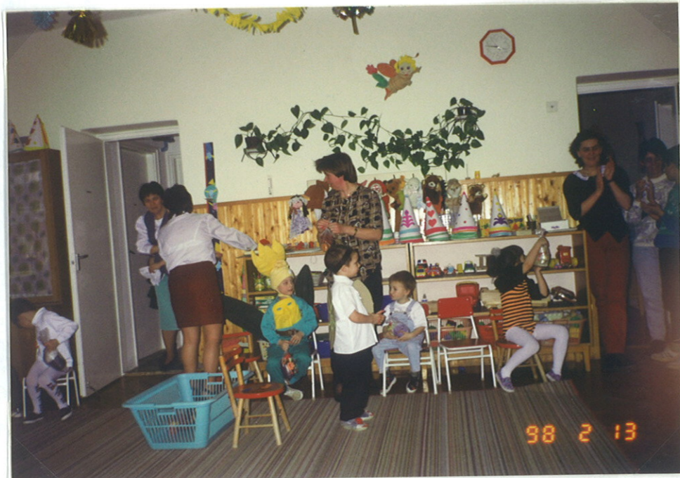
A nagyobbok az "állatok farsangja" c. műsorán - állat jelmezekben.