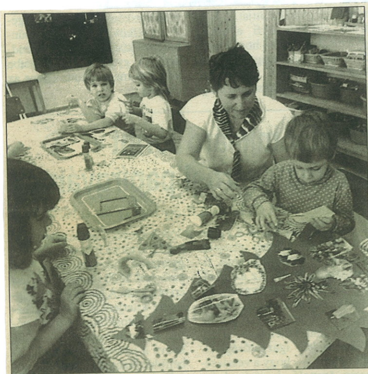
Parányi, ügyes kezek küzdenek az ollóval, szépül a fenyőfa