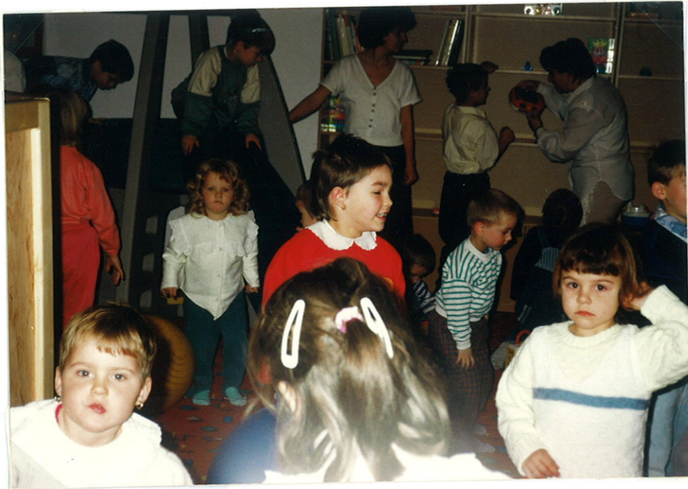
Vidám jöttek a játszószobában.

A délelőtt folyamán mesét is eljátszhattak. A Téliapó személyesen elbeszélgetett a gyerekekkel sőt még névre szóló levelet is kaptak tőle a gyerekek a szép rajzaikkal.