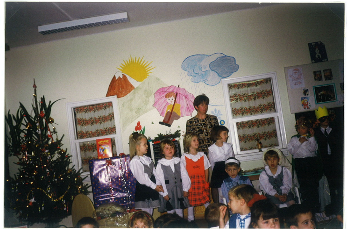
A „szüli napot” együtt ünnepeltük a komácsonnyal.