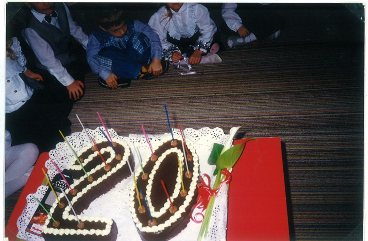
a „szüli napi” torta