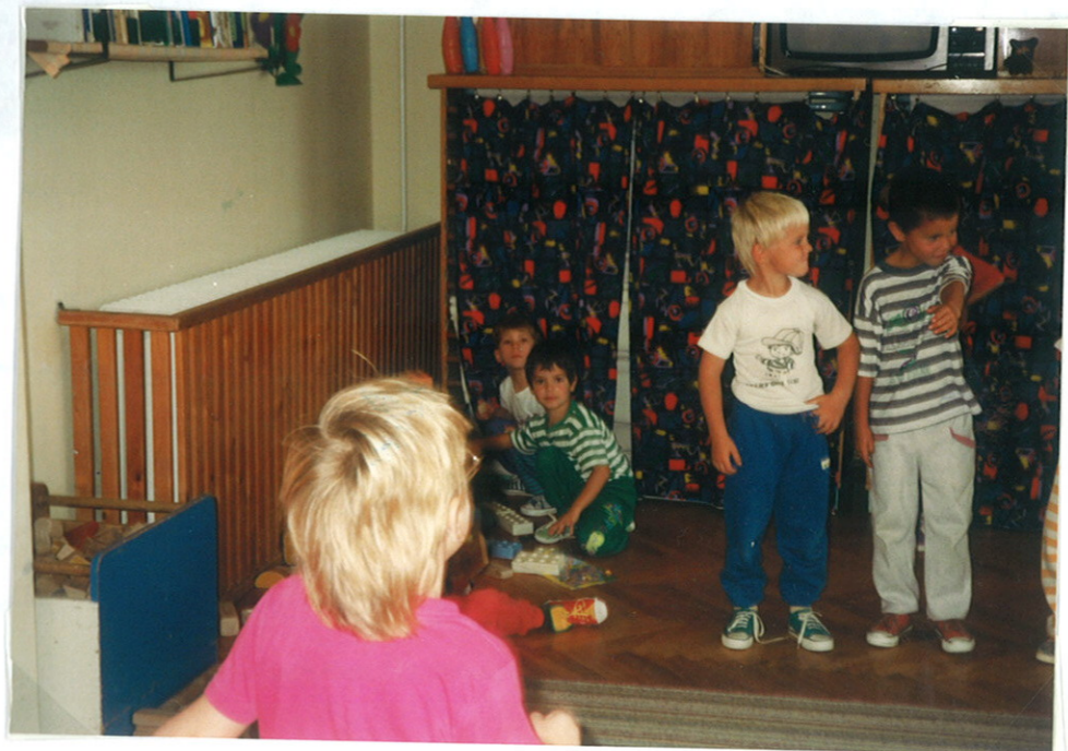
vonáskérés a játszósarokban.