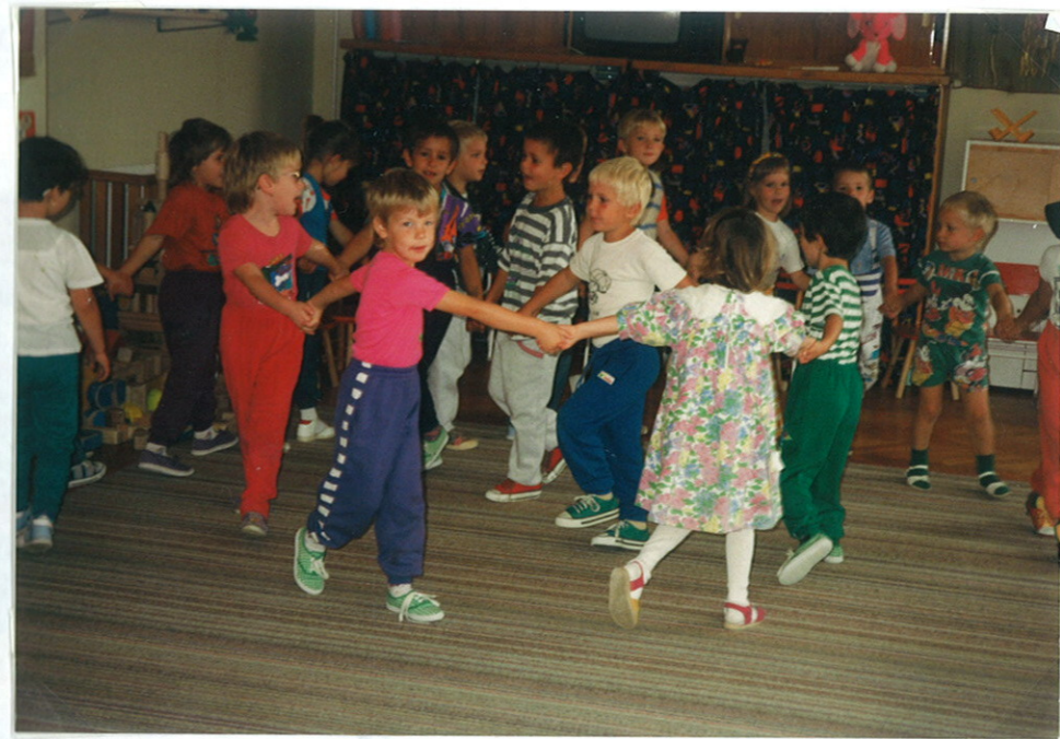
A "nagyfélétszámú" nagygyűjteményesek körjátéka.