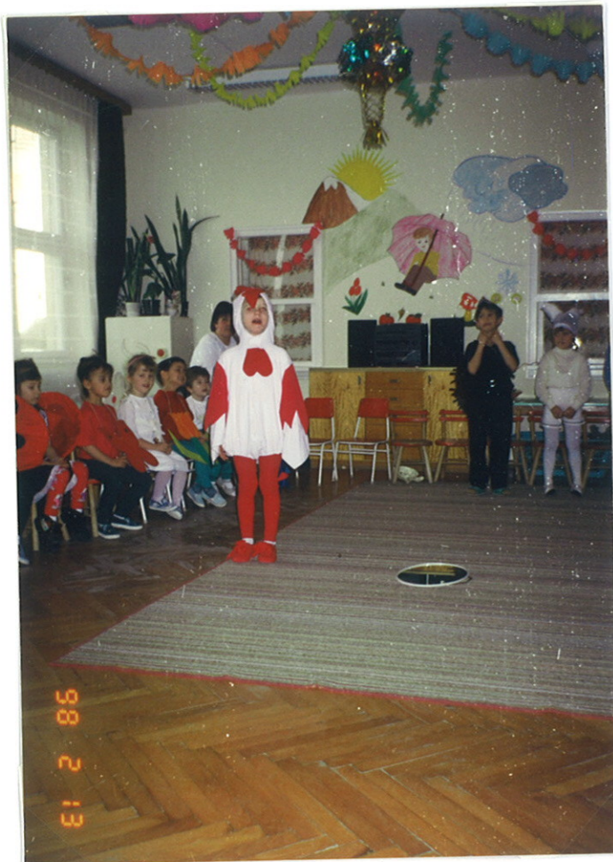
A beviteles farsangi bál pillanatai