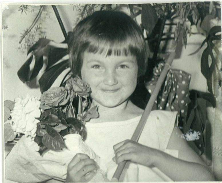
Az első ballagó nagycsoporthosok