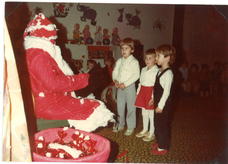
"Van azokban minden jó." - éreklék a gyerekek a Télapónak.

Az óvodai élet kedves, izgalommal várta esemé- nyét a télapó-várás. Vésztés és éreklés után aján- díkot oszt a jó Télapó.