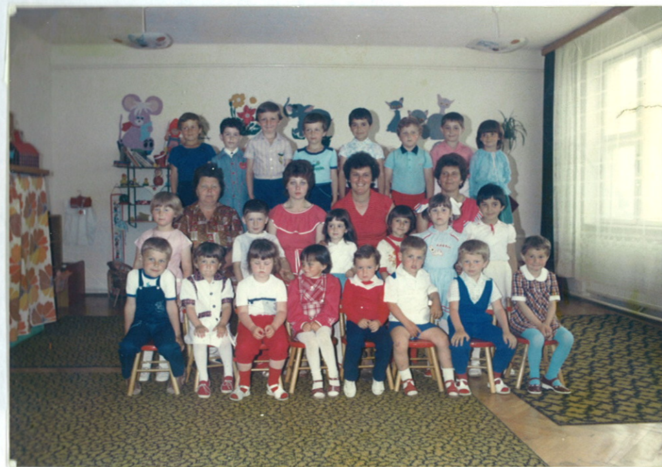
Csoportkép 1985 május