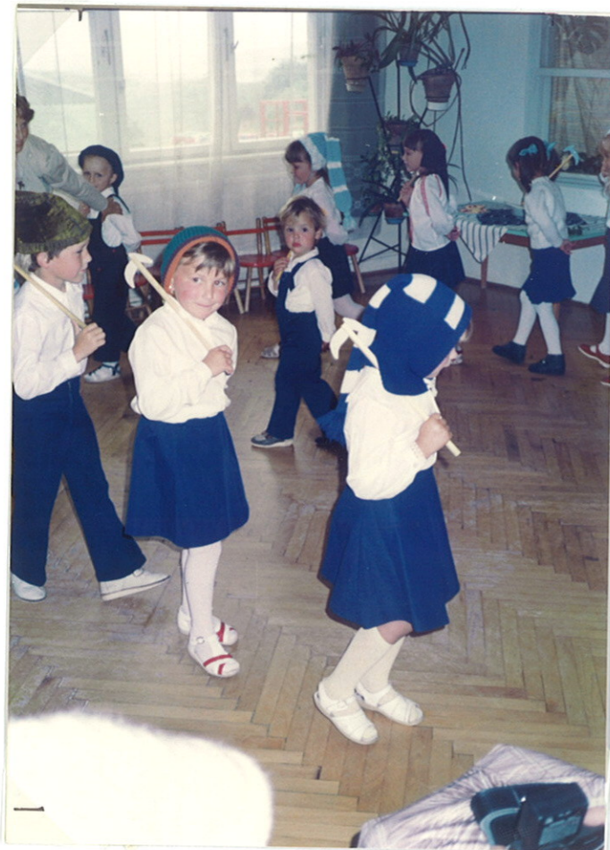
Törpék kis csákányokkal: