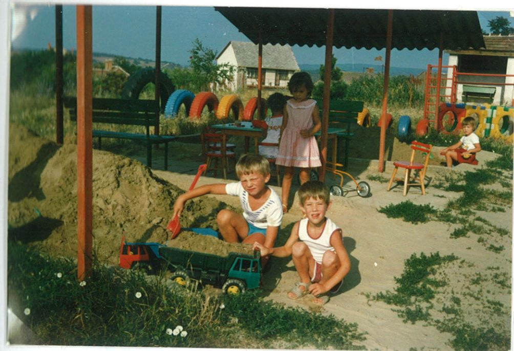
Nyári élet a homokozóban