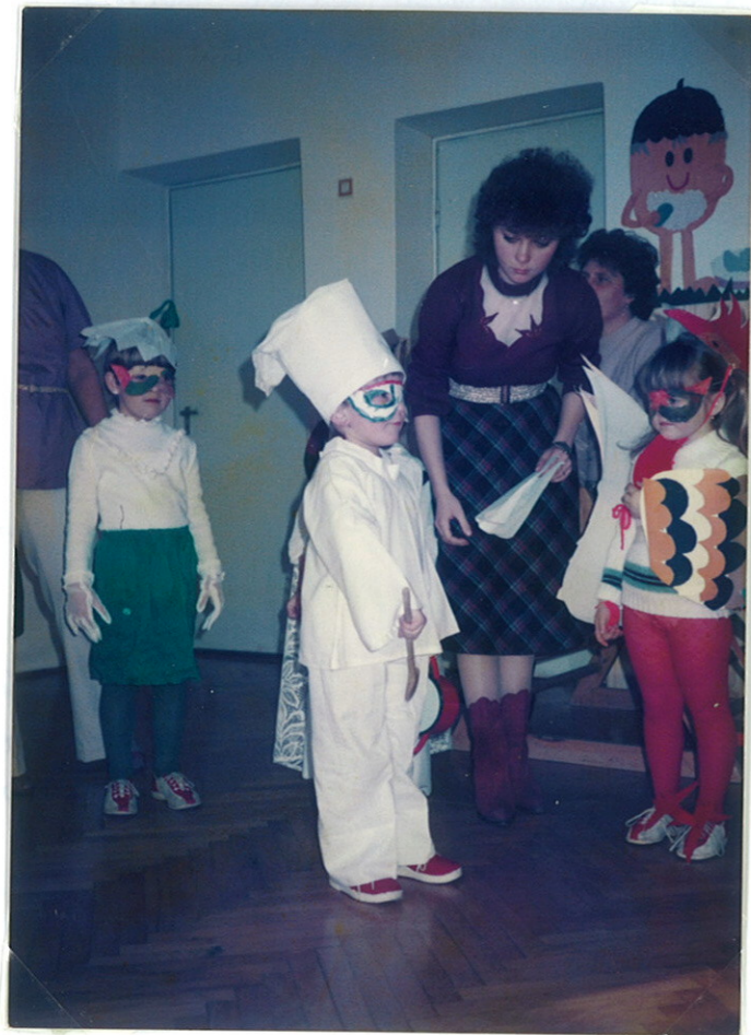
A farsangi bálon ötletes jelmezükbe öltöztek a gyerekek.