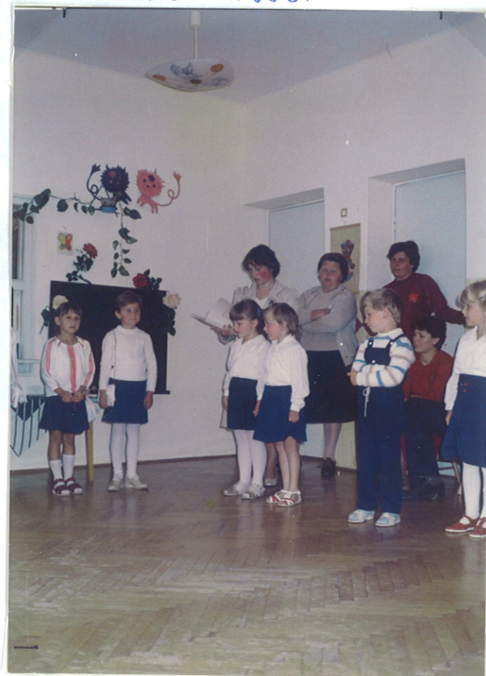
A kicsik verssel köszöntik a Télapót.