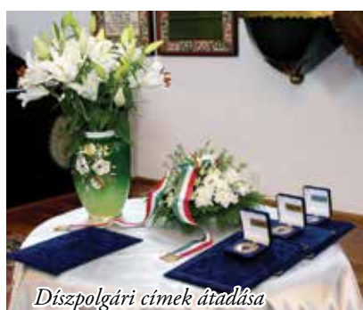
Díszpolgári címek átadása