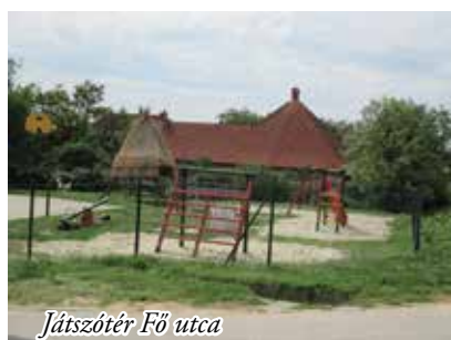
Játszóter Fő utca