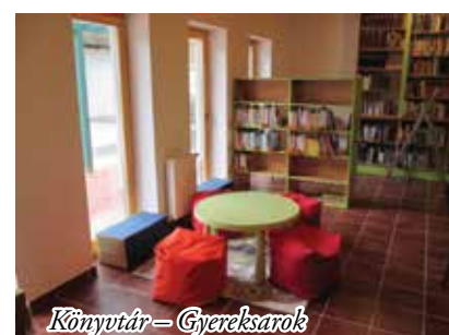
Könyvtár - Gyereksarok