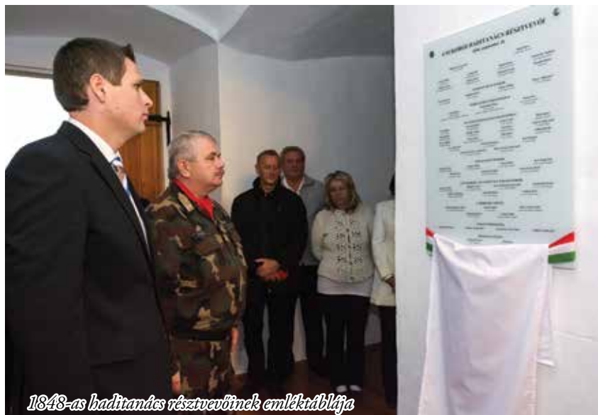
1848-as haditanács résztvevőinek emléktáblája