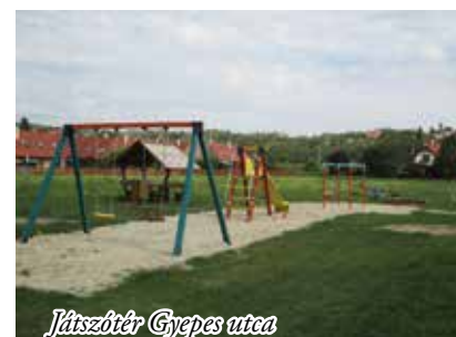
Játszóter Gyepes utca