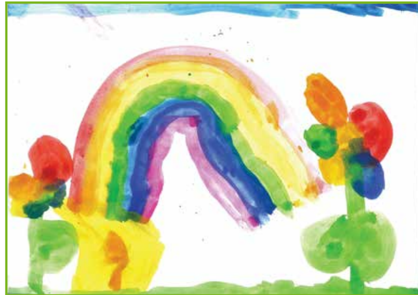
Borbély Nóra - Szivárvány (nagysoport)