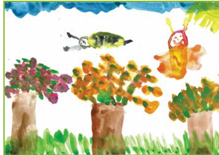
Hatházi Bernadett - Tavasz (nagysoport)