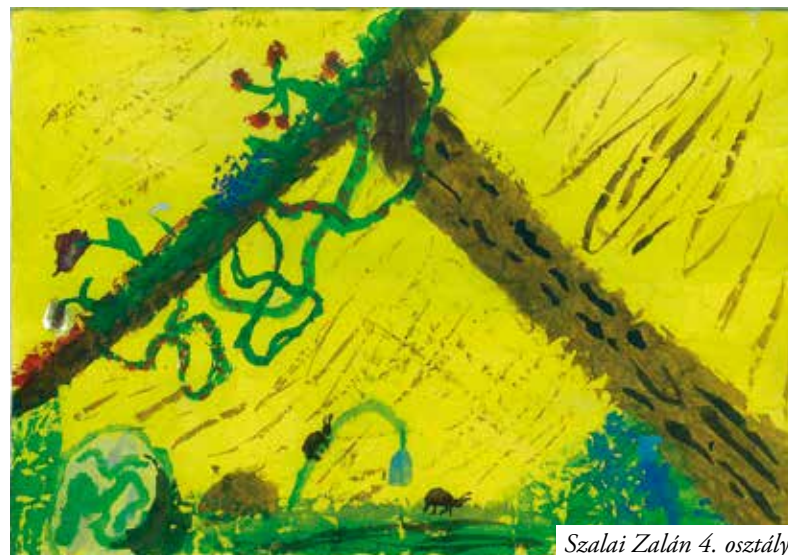
Szalai Zalán 4. osztály