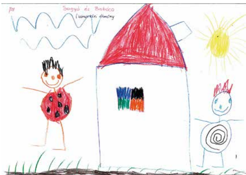
Szemerédi Márk (Maci csoport)