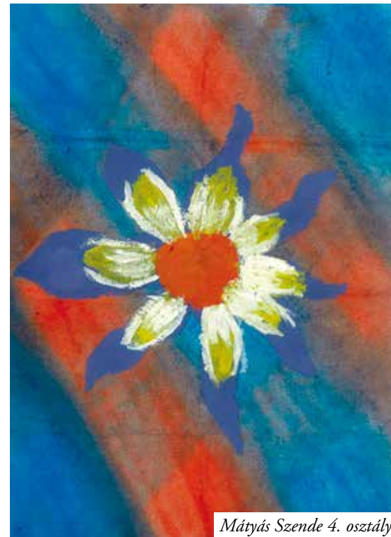
Mátyás Szende 4. osztály