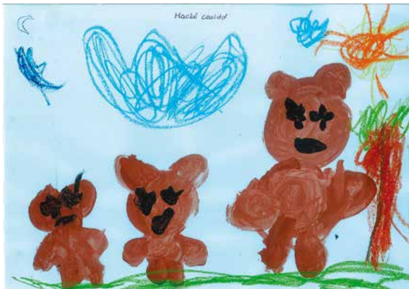
Küttel Réka Rozina (Maci csoport)