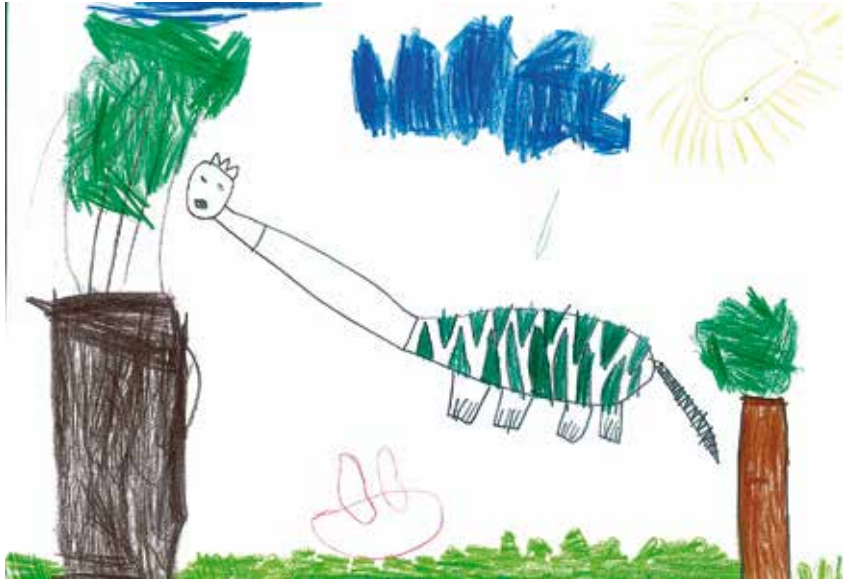
Bakó Tünde (Maci csoport)